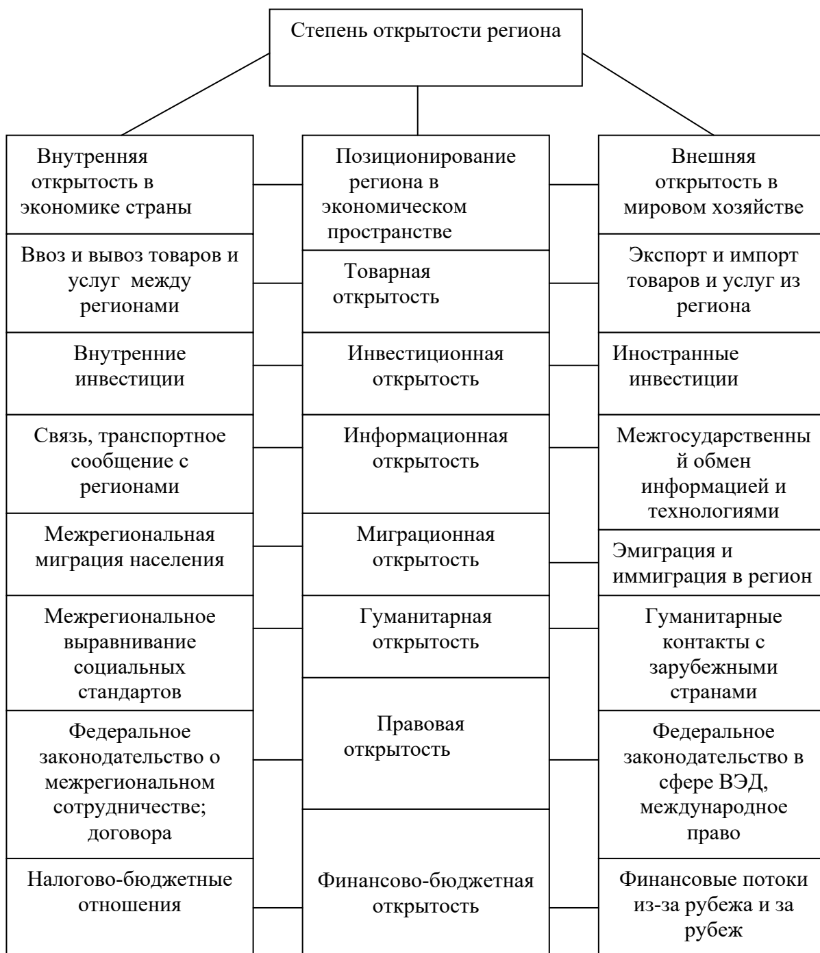
Рисунок 1. Компоненты внешней и внутренней открытости региона, характеризующие его позиционирование в экономическом пространстве.

- ориентация только лишь на одно или два направления экспортируемой продукции (Хакасия, Карелия, Коми, Липецкая, Мурманская, Белгородская, Вологодская области);